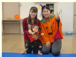
おばあちゃんありがとう