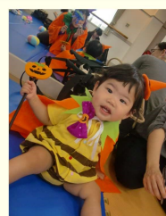
トリック オアトリート